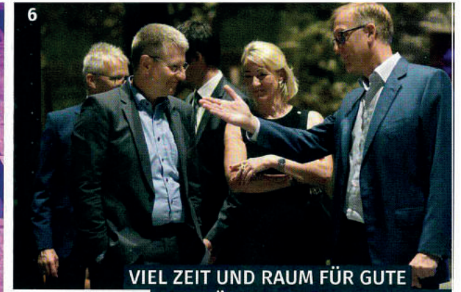
VIEL ZEIT UND RAUM FÜR GUTE GESPRÄCHE UND BEGEGNUNGEN