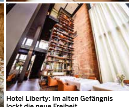
Hotel Liberty: Im alten Gefängnis lockt die neue Freiheit.

schöpft aus einem Füllhorn von regionalen Köstlichkeiten und legt Wert auf saisonale Gerichte. Die Spezialität des Hauses ist das am offenen Feuer grillierte Fleisch; vor allem ein 900 Gramm schweres Tomahawk-Steak, welches auf dem Holzbrett serviert wird.