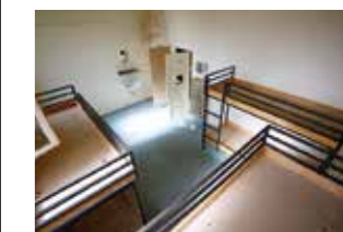
Bild oben und unten: So sah die JVA Oldenburg vor dem Umbau zum Liberty Hotel aus.